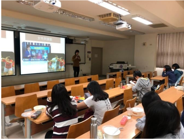
活 動 照 片