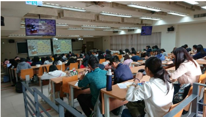
活 動 照 片