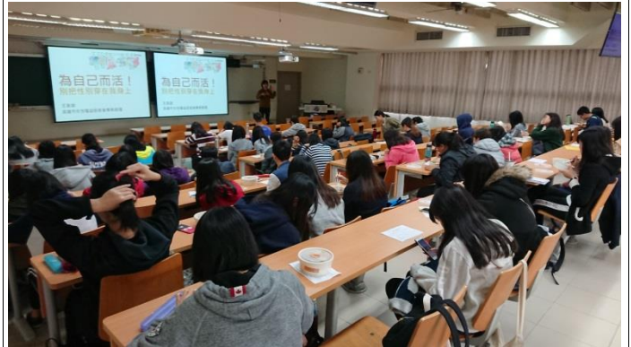
活 動 照 片